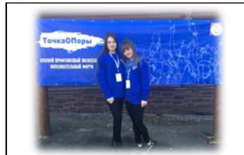
Профсоюзный молодежный образовательный форум «Точка опоры — 2018»