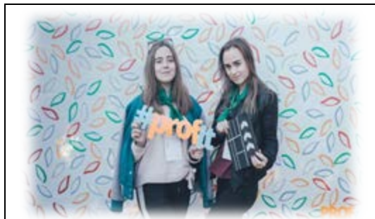
Школе актива «Profit2018» в поселке Джемете